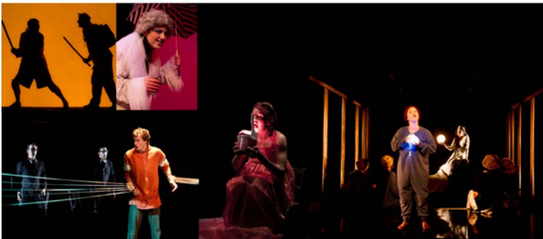
PRODUCTIONS : NOUS VOIR NOUS ET PIÈCES JEUNE PUBLIC CRÈME-GLACÉE, ANTOINE-LE-MUET, LES CHEVALIERS DE TERREBONNET ET LA VÉRITÉ SUR HONG-KONG